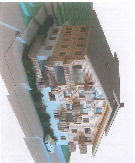
Coopérative d'habitation Nouveau Comté

En 2010, la Cooha a obtenu de la ville de Nyon l'attribution du contrat de droit de superficie. Avec le canton de Vaud, un concours d'architecture international a été lancé en 2013, qui a vu la victoire du bureau d'architectes lausannois Ferra & Zornboulakis, avec son projet «Zinzolin». Enfin, en octobre 2017, la demande de permis de construire a été déposée. En 2014 déjà, le Fonds de solidarité avait apporté son soutien à l'ambitieux projet de construction, dont les coûts se montent à 59 millions de francs au bas mot, par un prêt transitoire de 650 000 francs.